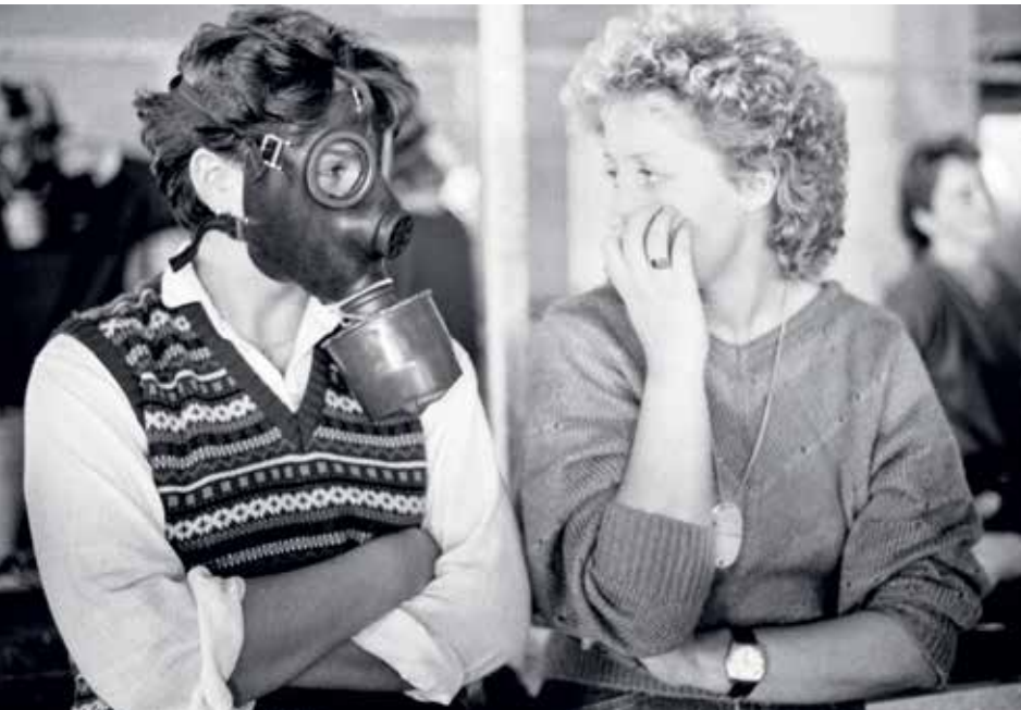
← Anprobe der Gas- und Schutz- maske in der Kaserne. Frauen- rekrutenschule Romont, Frei- burg.