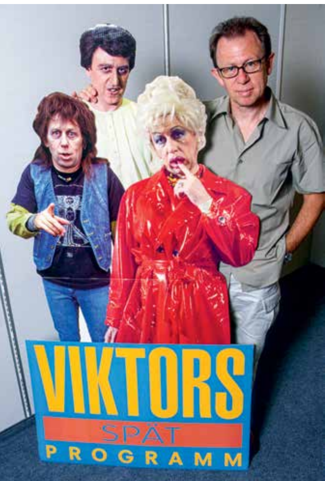
↑ links: Kabarettist Viktor Giacobbo mit Pappfiguren seiner Rollen. Abschied vom «Spätprogramm» im Schweizer Fernsehen.