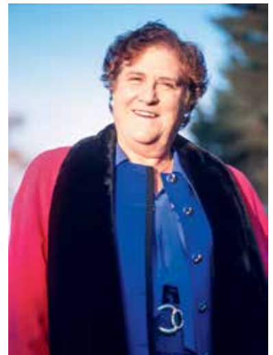
↑ oben: Performance an der Frauenkulturwoche in der Roten Fabrik. Zürich 1981; unten: Emilie Lieberherr (1924–2011), Politikerin und Kämpferin für die Frauenrechte. Zugerberg 1993.