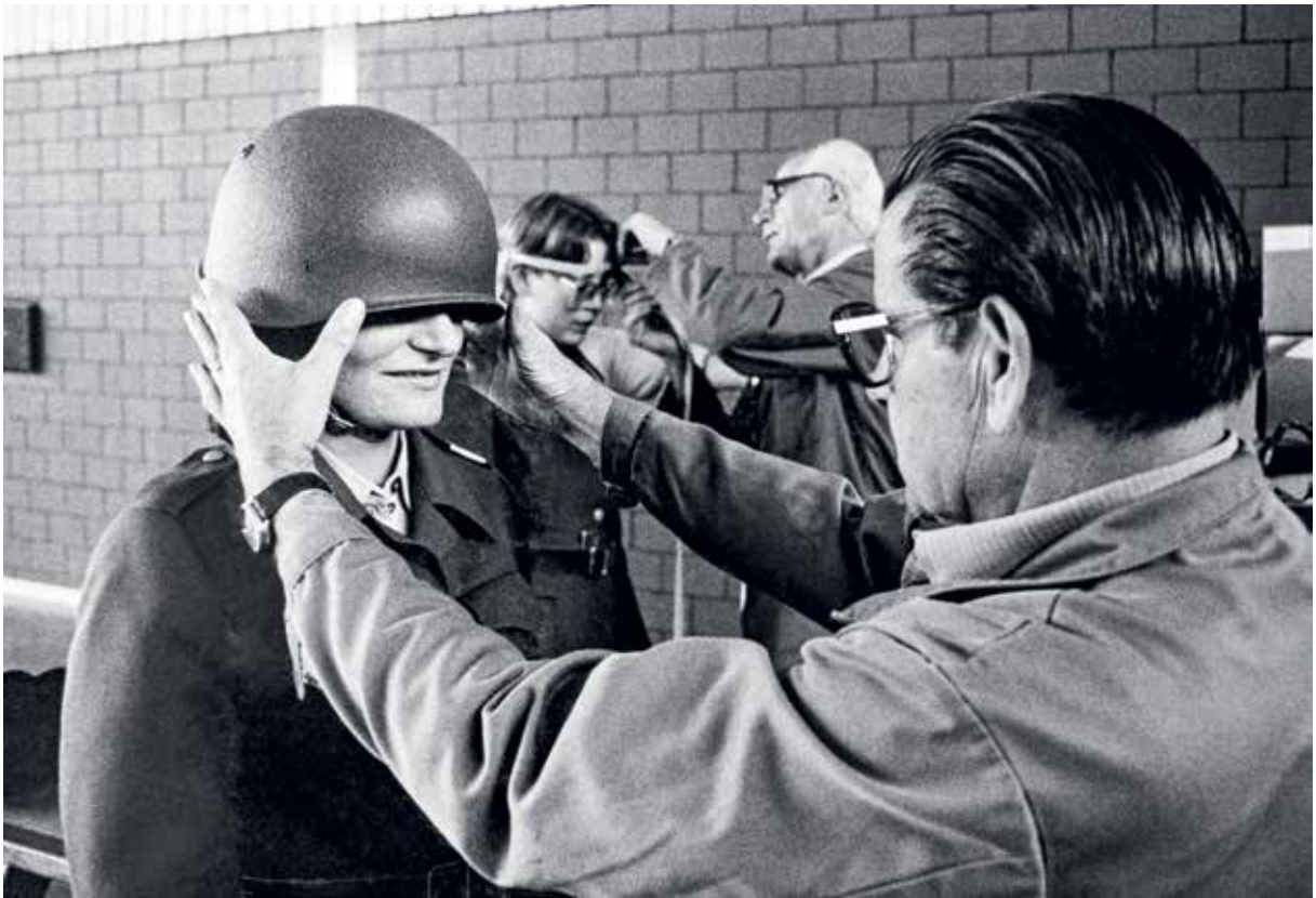
↑ Helm auf. Von der Zivilkleidung in die Uniform. Frauenrekruten- schule Kloten, Zürich.