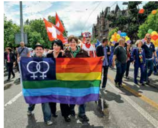
↑ oben: AHV-Demonstration auf dem Bundesplatz. Bern 1994; unten: Europride für die Rechte von LGBTQ+. Zürich 2009.