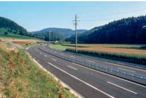
↑ Vorher: Effingen, Aargau. Blick Richtung Bözberg, 1982. Nachher: Autobahn A3 vor der Eröffnung, 1996.