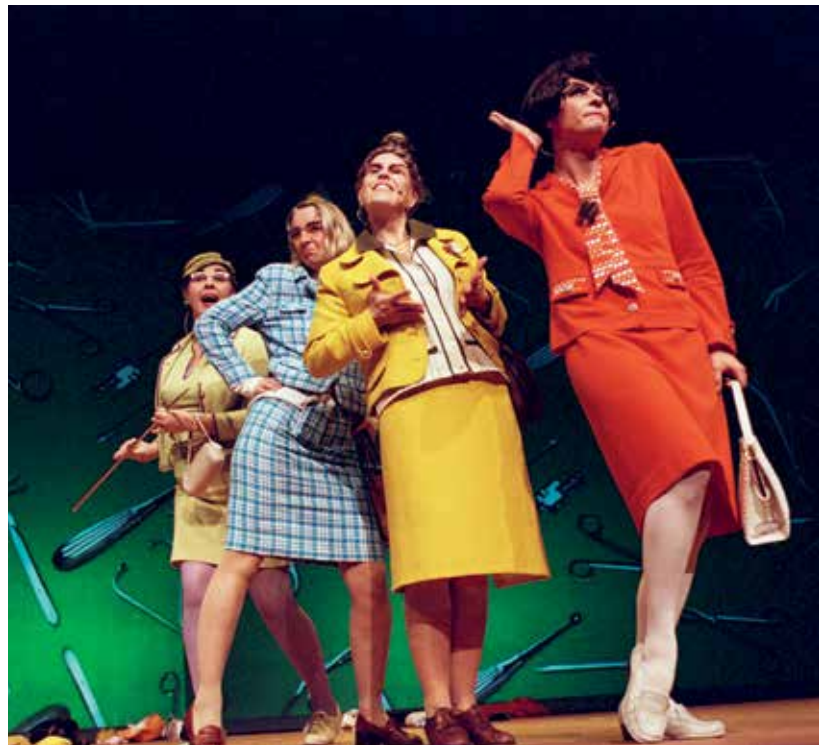
↑ rechts: 10 Jahre Frauen-Musik-kabarett-Gruppe Acapickels. Multimedia-Show im Theater 11. Zürich.