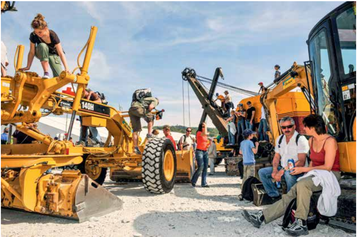
Fest zur Eröffnung der Zürcher Westumfahrung und des Uetlibergtunnels.