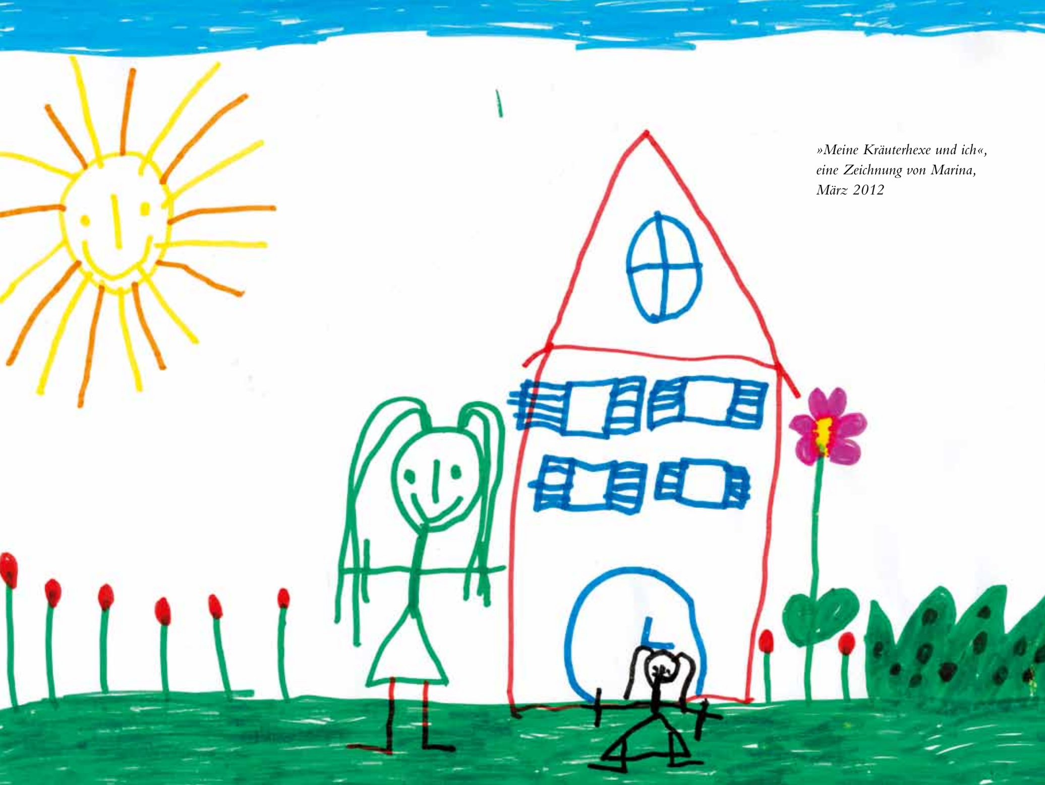
»Meine Kräuterhexe und ich«, eine Zeichnung von Marina, März 2012